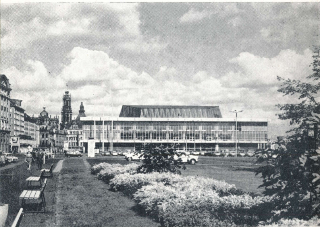
Der Kulturpalast Dresden im Stadtzentrum – Blick vom Altmarkt